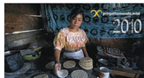
La ricetta giusta per un mondo più... buono!

Per maggiori informazioni sui nostri progetti e per l'acquisto dei biglietti scrivere a sostegno@mlal.org o telefonare allo 045-8102105.